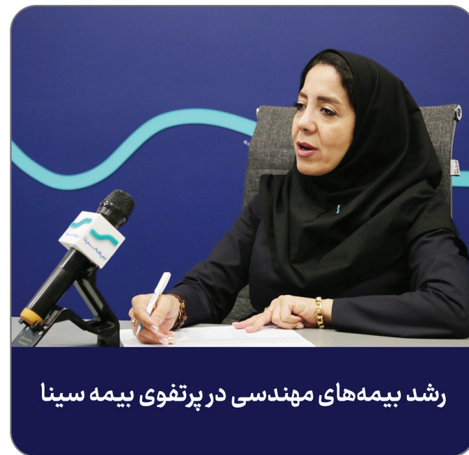
رشد بیمه‌های مهندسی در پرتفوی بیمه سینا